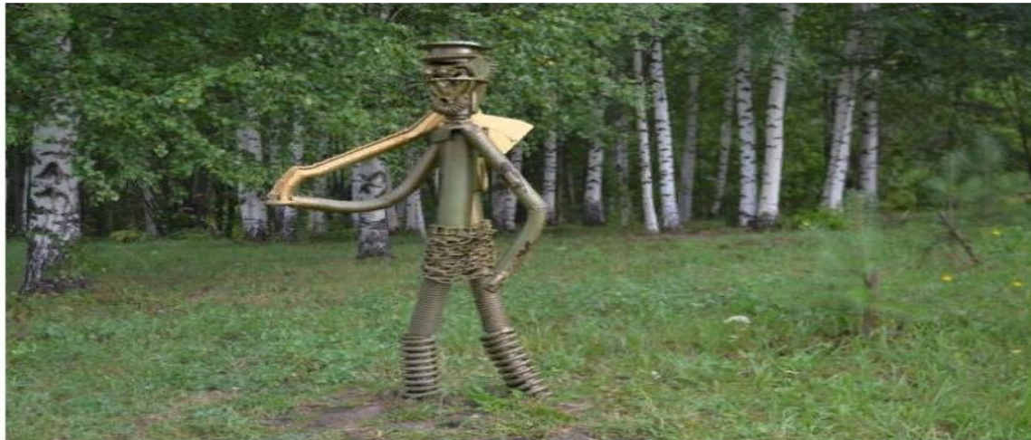
Железяки - главные «герои» парка на аллее Интернационалистов.

Еженедельник "Аргументы и Факты" № 36. АиФ в Кузбассе №36 02/09/2020